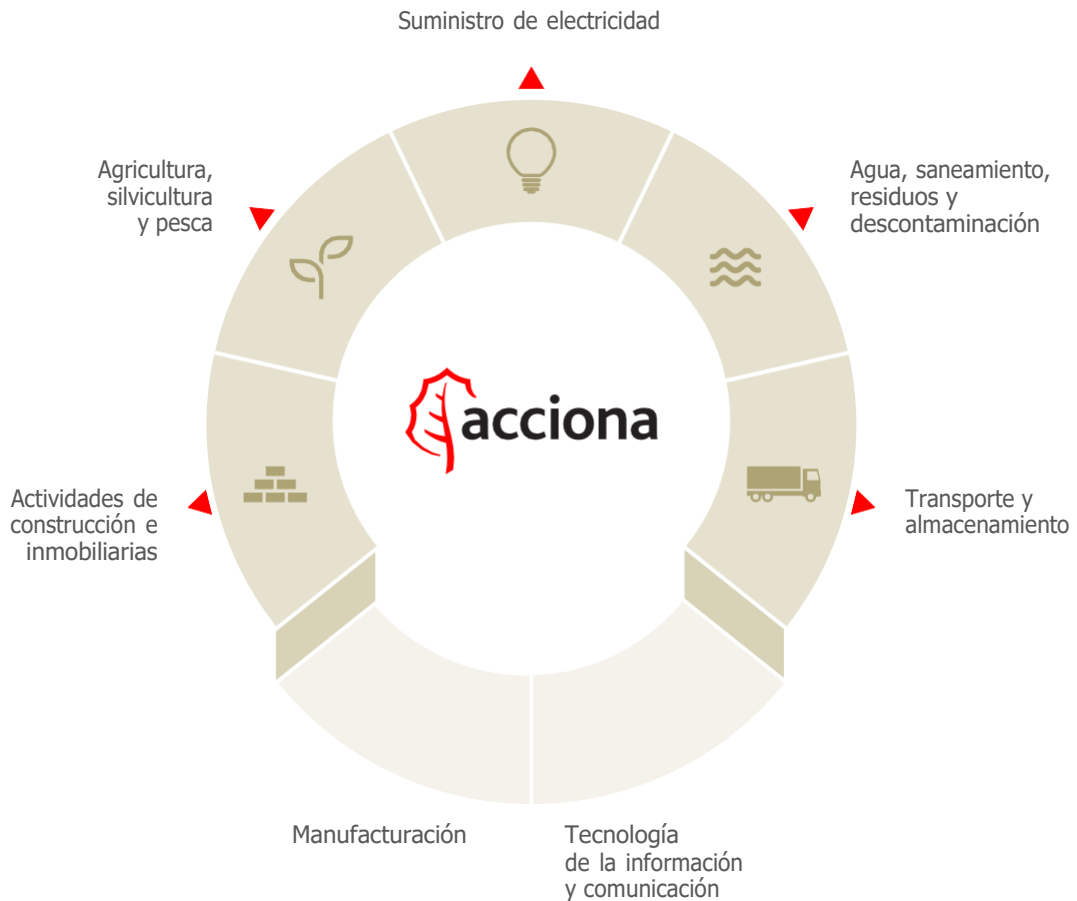
Gráfico 1. Actividades de ACCIONA en los macrosectores de la taxonomía de la UE

Un análisis de las actividades de ACCIONA 8 muestra que éstas encajan en cinco de los macrosectores establecidos por la taxonomía de la UE (18 de junio de 2019). Los grupos identificados son los siguientes: